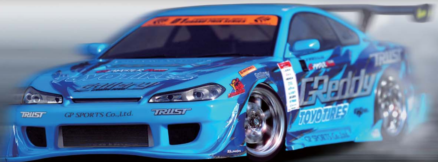
写真はプロトタイプです。

※本製品は模型の為、組立・塗装などの作業が必要になります。 また、走行するには別途R/C装置が必要になります。