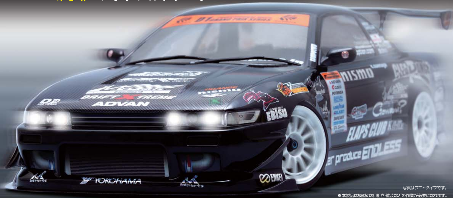
写真はプロタイプです。

*本製品は模型の為、組立・塗装などの作業が必要になります。また、走行するには別途R/C装置が必要になります。