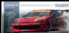
HKS HIPER SILVIA S15 組立キット ¥24,990 (税込)