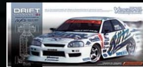
BLITZ ER34 D1 SPEC 組立キット ¥24,990 (税込)

TOP SECRET PERFORMANCE ENGINEERING SERVICE