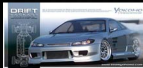
NISSAN S15 SILVIA 組立キット ¥22,890 (税込)