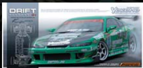
KEI OFFICE S15 SILVIA 組立キット ¥24,990 (税込)