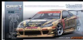
TOP SECRET S15 SILVIA 組立キット ¥24,990 (税込)

TOP SECRET PERFORMANCE ENGINEERING SERVICE