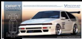
TOYOTA AE86 TRUENO 組立キット ¥22,890 (税込)