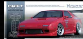
MAZDA FC3S RX-7 組立キット ¥22,890 (税込)