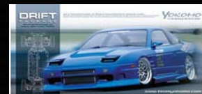
NISSAN 180SX 組立キット ¥22,890 (税込)