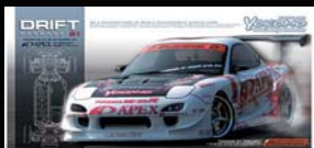
A'PEX D1 PROJECT FD3S 組立キット ¥24,990 (税込)